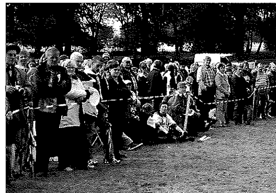
Viele interessierte Zuschauer säumen den Weg entlang der Geländestrecke in Renzow.