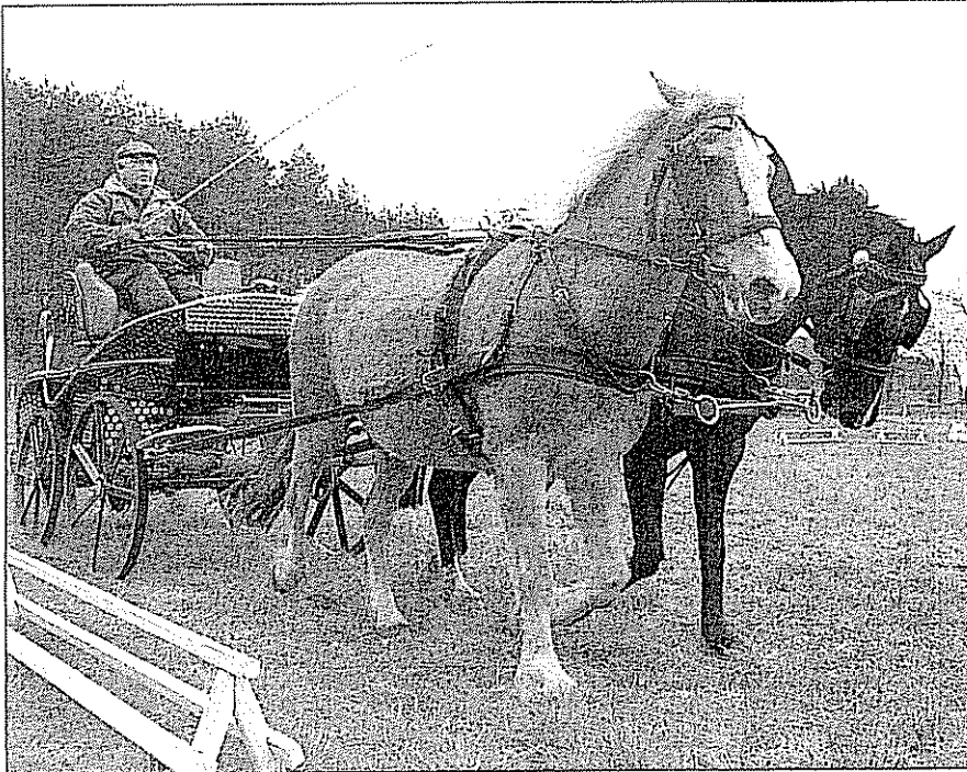
Eckhard Büsch aus Badow nahm das Angebot von Lothar Volkwein dankend an und ließ sich im Gespannfahren weiter ausbilden.